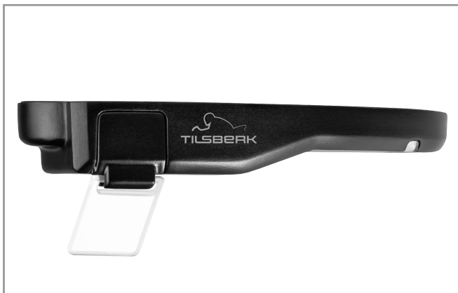
Head-Up Modul für Motorradhelme mit integriertem Display und Optik