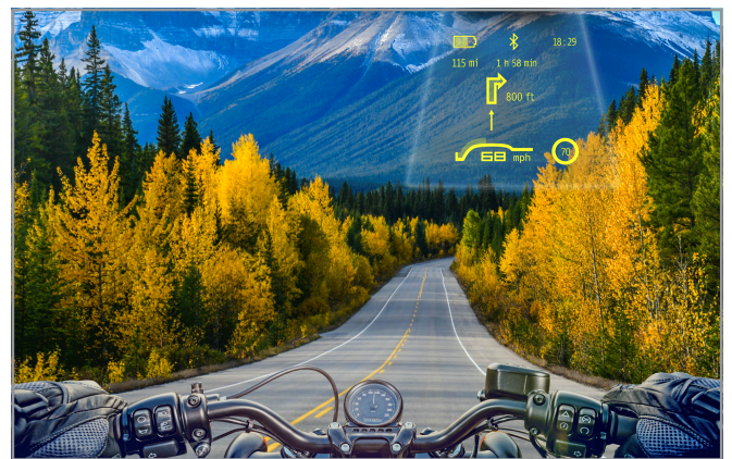
Bereits erhältlich und im Einsatz: Das Head-Up Display für Motorradhelme von „Tilsberk“ (eine Marke der digades GmbH)