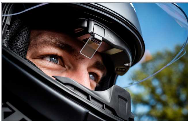
Bereits erhältlich und im Einsatz: Das Head-Up Display für Motorradhelme von „Tilsberk“ (eine Marke der digades GmbH)